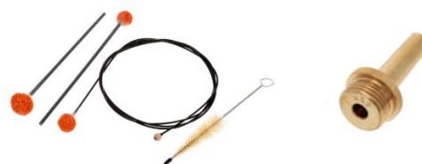
Reinigungsset für Blechbläser, Adapter für handelsüblichen Brauseschlauch