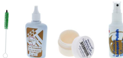
Mundstückbürste, Ventil-Öl, Zugfett, Lackpflegemittel